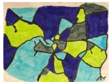
Mapiau o drefi yng ngwledydd Prydain a'r Aiffat